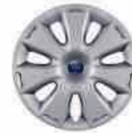
16-tolline seitsme topeltkodaraga ilukilp (valikvarustuses Trendil).