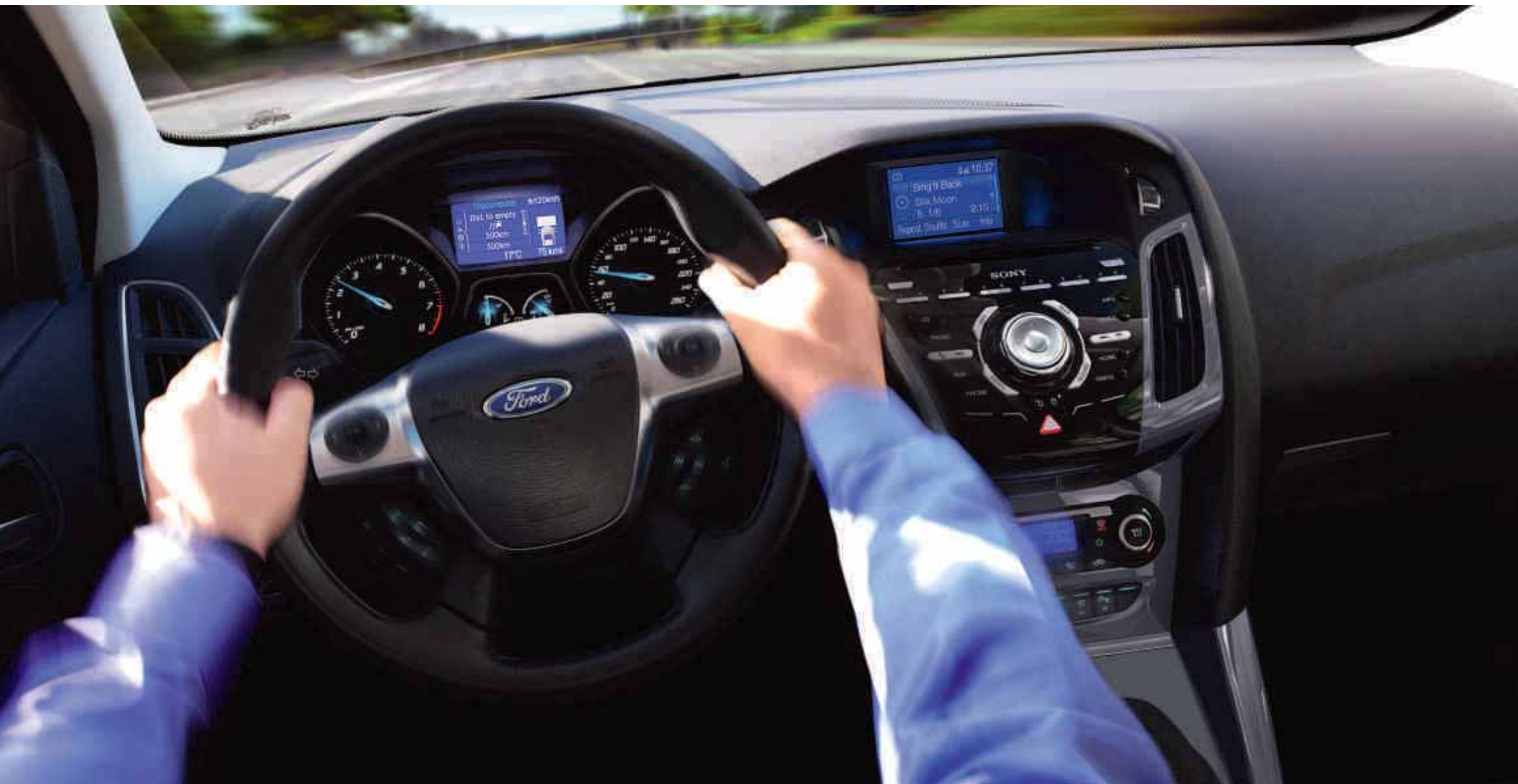
Pildil on mudel Ford Focus Titanium koos SD-navigatsioonisüsteemiga (lisavarustuses).

Uue Ford Focus'e jõuline isikupära jätkub salongis. Juhti ümbritseb tema vajadusi arvestav salong, tekitades autoga täieliku ühtesulamise tunde, ning tipp tehnoloogia ja suurepäraseid funktsioone on kohe käeulatuses.