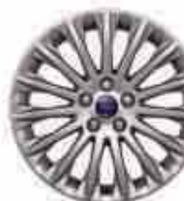
17-tolline 15 kodaraga valuvelg (lisa- ja valikvarustuses). Osa number 1719527