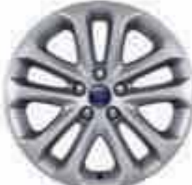
17-tolline viie topeltkodaraga valuvelg (valikvarustusena). Osa number 1710606