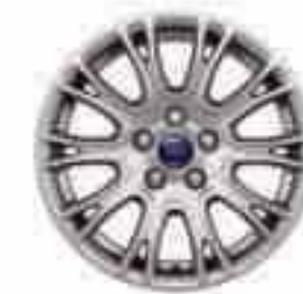
16-tolline kumne topeltkodaraga valuvelg (standardvarustuses Titaniumil, lisa- ja valikvarustuses teistel mudelitel). Osa number 1715343