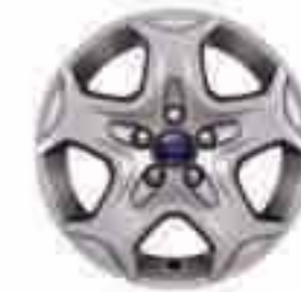
16-tolline viie kodaraga disainvelg (valikvarustuses Trendil).