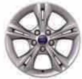
16-tolline viie topeltkodaraga valuvelg (lisa- ja valikvarustuses). Osa number 1715341