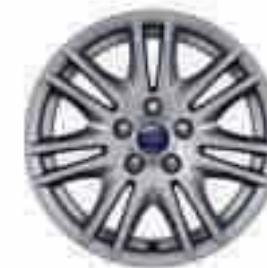
16-tolline seitsme topeltkodaraga valuvelg (valikvarustuses). Osa number 1710604