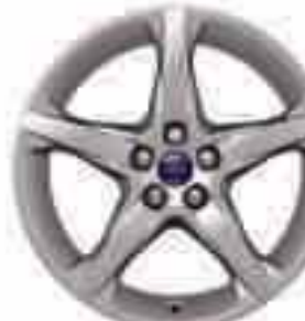
18-tolline viie kodaraga valuvelg (lisa- ja valikvarustuses). Osa number 1719526