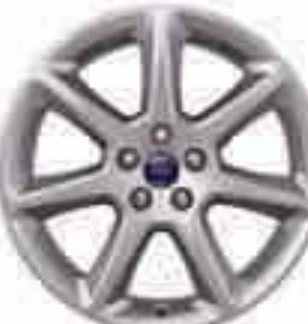
18-tolline seitsme topeltkodaraga valuvelg (valikvarustusena). Osa number 1702126

Pildil on mudel Ford Focus Titanium, millel on metallikvrv Candy Red (lisavarustuses) ja 18-tollised viie kodaraga valuveljed (lisa- ja valikvarustuses).