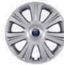
16-tolline seitsme kodaraga ilukilp (standardvarustuses Ambientil)

Valik erisulamist eriotstarbelisi velgi uue Ford Focus e dunaamilise liini taendamiseks.