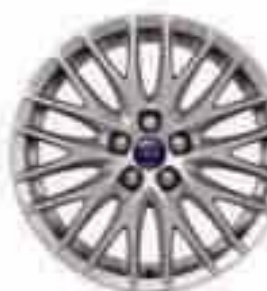
17-tolline kumne topeltkodaraga valuvelg (lisa- ja valikvarustuses). Osa number 1719524